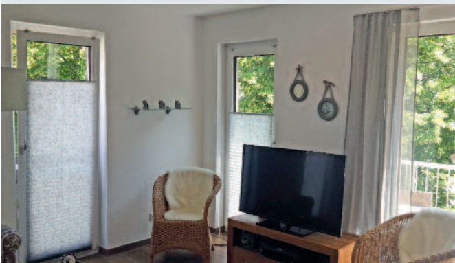
Plissees und Vorhang lassen Licht hinein, schützen aber vor neugierigen Blicken.